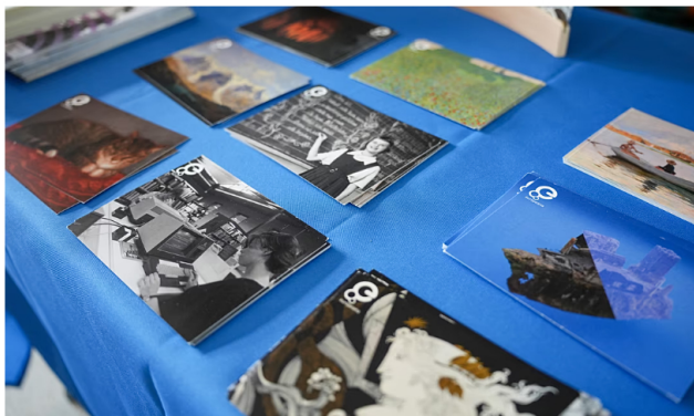
Digital Heritage Summit 2026 - Πάμπρος Χαρολάμπους

Το Digital Heritage Summit 2026 πραγματοποιήθηκε υπό την αιγίδα της Κυπριακής Προεδρίας του Συμβουλίου της Ευρωπαϊκής Ένωσης .