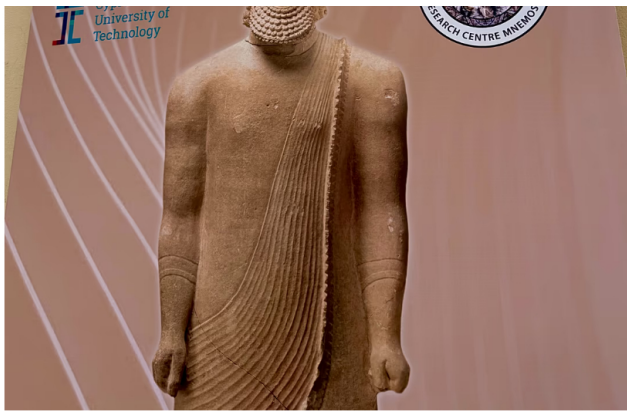
Digital Heritage Summit 2026 - Απόστολος Στάκος

Ένα από τα θέματα που συζητήθηκαν είναι και η προστασία της πολιτιστικής κληρονομιάς, καθώς και ο επαναπατρισμός αρχαιοτήτων που παράνομα αφαιρέθηκαν από κάποιες χώρες.