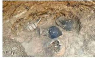
Τα αρχαία που βρήκε ο ΣΑΛΑ όσο έφτιαχνε το αντιπλημμυρικό στη Λεμεσό