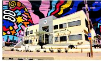
Πρόσκληση υποβολής προτάσεων για παραστατικές τέχνες από Δήμο Ύψωνα