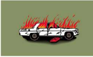
Εμπρησμός οχήματος έξω από πρατήριο βενζίνης στη Λεμεσό