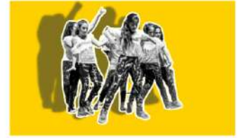
Street Life Festival Returns on April 27, 2024