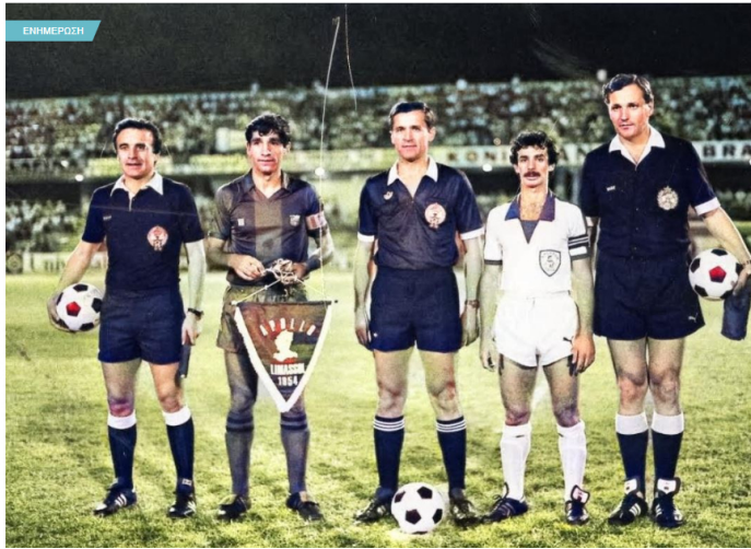
Εικόνα : ΑΠΟΛΛΩΝ ΛΕΜΕΣΟΥ – ΜΠΑΡΤΣΕΛΟΝΑ 1-1 (Τσίροο στάδιο, 30 Σεπτεμβρίου 1982, Κύπελλο UEFA)

By Lemesolian | Apr 12, 2020 | Be the first to comment!