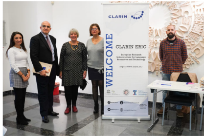
Εναρκτήρια τελετή και συνάντηση ενημέρωσης Κυπριακών πανεπιστημίων, φορέων και ερευνητών

Από την 1 η Μαΐου 2019 η Κύπρος έχει ενταχθεί επίσημα στην Ευρωπαϊκή Υποδομή CLARIN ERIC και εκπροσωπείται από την Έδρα της ΟΥΝΕΣΚΟ στην Ψηφιακή Πολιτιστική Κληρονομιά στο Τεχνολογικό Πανεπιστήμιο Κύπρου (ΤΕΠΑΚ). Η εναρκτήρια τελετή έλαβε χώρα στις 3/12/2019 στο Πολιτιστικό Ίδρυμα της Τράπεζας Κύπρου στη Λευκωσία, όπου έτυχαν ενημέρωσης εκπρόσωποι Κυπριακών πανεπιστημίων, φορέων και ερευνητικών κέντρων.