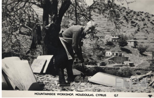
MOUNTAINSIDE WORKSHOP, MOUDOULAS, CYPRUS G.7

Το παρόν φροντιστήριο εστιάζει και το ρομπότ της τέχνης του ελαστικού. Σημείο στρατηγικής σημασίας είναι η διεύθυντής του πολυβραβευμένου Εργαστηρίου Ψηφιακής Πολιτιστικής Κληρονομιάς του ΤΕΠΑΚ, δρ Μαρίνος Ιωαννίδης, η εκδήλωση πραγματοποιείται στο πλαίσιο του Ευρωπαϊκού Έργου REXNÉU για το Ευρωπαϊκό Έτος Πολιτιστικής Κληρονομιάς «We Make Europe for Culture» και αποτελεί την δέκατη και τελευταία σε σειρά από αντίστοιχες εκδηλώσεις που έχουν ήδη διοργανωθεί σε άλλες χώρες της ΕΕ.