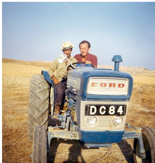
Αγροτική ζωή στα Γεράνια Αμμοχώστου. Το χωριό Γεράνια βρίσκεται περίπου 27 χιλιόμετρα βόρεια της Αμμοχώστου. Πριν το 1974 ήταν κατοικημένο από Ελληνοκύπριους. Το χωριό πήρε το όνομά του από το φωτο γεράνι.